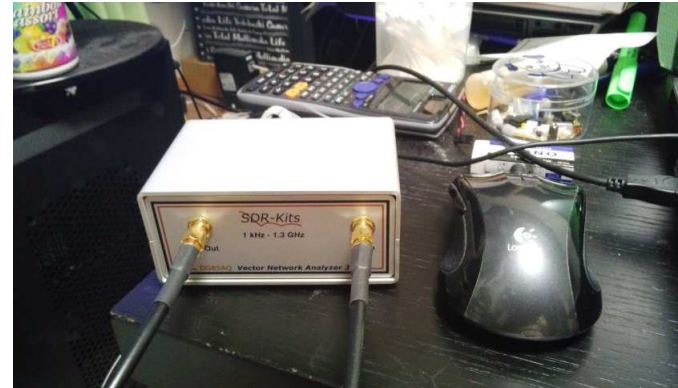
Cap.1 VNWA3N 全体図

500MHz以上はPLLをオーバーサンプリングしているようで、 実用には厳しい。